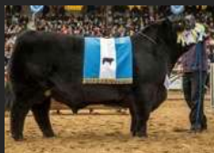
TRES MARIAS 9257 FEDERAL