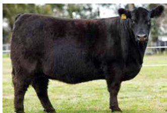
TM PISTERA – MÃE DE REGADERA

NO PACOTE A REGADERA VEM ACASALADA COM O BI GRANDE CAMPEÃO DE PALERMO, TRES MARIAS A348 DON EMILIO , QUE EM SUA PRIMEIRA GERAÇÃO PRODUZIU A CAMPEÃ BEZERRA E TERCEIRA MELHOR FÊMEA DE PALERMO 2019.