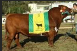
FILHO DE BRIGADIER