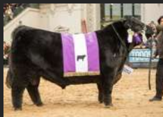
ERRE TE383 CONDOR EURO