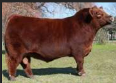
LUQUENSE 1911 ENTRADOR 8588