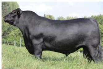
PWM TEMP – IRMÃO DE TYPE - BATERIA CB GENETICS

O PACOTE É ACASALADO COM O BI GRANDE CAMPEÃO DE PALERMO TRES MARIAS A348 DON EMILIO .