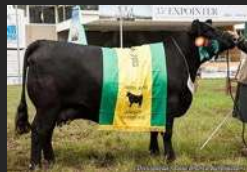
FILHA DE ZORZAL