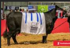
FILHA DE CANDELERO