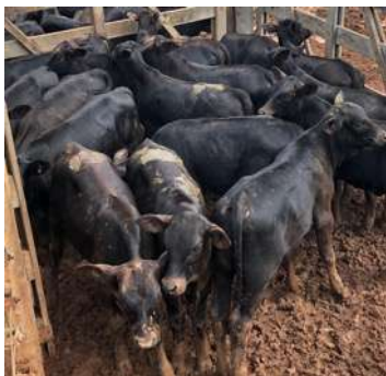
PRODUÇÃO PWM SEATTLE – LASA AGROPECUÁRIA

TRASMITE A SUA PROGÊNIE MUITO COMPRIMENTO E VELOCIDADE DE GANHO DE PESO.