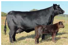
PWM ROMANCE – IRMÃ MATERNA DE REI