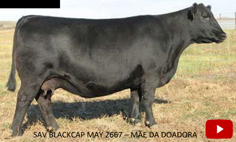
SAV BLACKCAP MAY 2667 – MÃE DA DOADORA