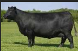
MÃE DE RENOVATION