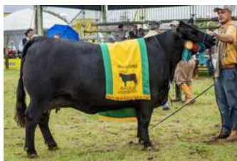
BARONESA – GRANDE CAMPEÃ EXPOINTER 2016 MÃE DE DIVA

O PACOTE VEM ACASALADO COM O BI GRANDE CAMPEÃO DE PALERMO, TRES MARIAS A348 DON EMILIO , QUE EM SUA PRIMEIRA GERAÇÃO PRODUZIU A CAMPEÃ BEZERRA E TERCEIRA MELHOR FÊMEA DE PALERMO 2019.