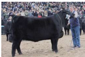
MOROCHA - MÃE DE RELIQUIA

O PACOTE B É ACASALADO COM CANDELERO TOURO DA DÉCADA NO BRASIL, QUE PRODUZIU EM 2019, A GRANDE CAMPEÃ DE PALERMO NA ARGENTINA E A GRANDE CAMPEÃ DO CONGRESSO MUNDIAL NO URUGUAI.