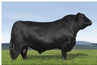
PWM REI - IRMÃO DE RELIQUIA, - BATERIA CB GENETICS

O PACOTE A É ACASALADO COM ZORZAL A MESMA COMBINAÇÃO QUE PRODUZIU AS BEZERRAS DE NOSSO TIME DE PISTA.