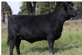
DAYTONA FILHA DE PAINTING COM CANDELERO

O PACOTE A É ACASALADO COM EURO E TRAZ A MESMA COMBINAÇÃO DE SANGUE QUE PRODUZIU O BI-GRANDE CAMPEÃO DE PALERMO DON EMÍLIO .