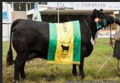
FILHA DE ZORZAL