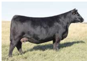
SAV BLACKCAP MAY 8051 - MÃE DE PUREBRED COMERCIALIZADA POR US$110.00,00 NO LEILÃO DA SAV EM 2016

EM SUA PRIMEIRA GERAÇÃO PRODUZI PWM ALINA , RESERVADA GRANDE CAMPEÃ EXPOINTER 2019 E RECORDISTA DO LEILÃO CASA BRANCA 2019.