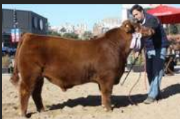
ENTRADOR COM 1 ANO