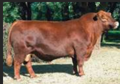
PASTORIZA 565 BRIGADIER