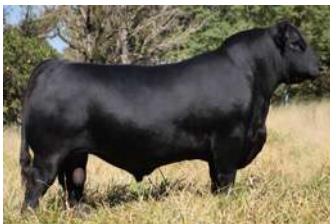
FOREMAN – FILHO DE DOMINGAS COM CANDELERO

O PACOTE É ACASALADO COM CANDELERO , REPETINDO O MESMO ACASALAMENTO QUE PRODUZIU FOREMAN E CASH .