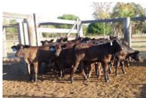
PROGENIE F1- CASA BRANCA MT

SEU FILHOS NASCEM PEQUENOS E POSSUEM EXCELENTE DESENVOLVIMENTO PONDERAL ALIADO A PRECOCIDADE PARA TERMINAÇÃO.