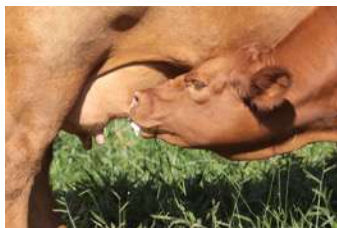
ÚBERE DE ANASTÁCIA

NO PACOTE A VEM ACASALADA COM ENTRADOR , O REPRODUTOR VERMELHO MAIS COMENTADO DOS ÚLTIMOS ANOS NA ARGENTINA.