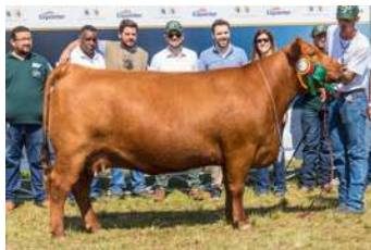
BELISSIMA TERCEIRA MELHOR FÊMEA EXPOINTER 2019

O PACOTE É COM ENTRADOR , DUAS VEZES CAMPEÃO EM PALERMO E CONSIDERADO COMO O GRANDE REPRODUTOR VERMELHO DO MOMENTO NA ARGENTINA.