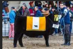
FILHA DE DON EMILIO