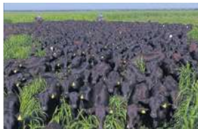
PROGENIE F1- AGROPECUÁRIA LEOPOLDINO

SAV BISMARCK 5682 SAV BLACKCAP MAY 8051 SAV BLACKCAP MAY 6517