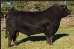
FILHO DE ZORZAL