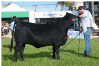
CAMBRIDGE – FILHA DE ROMANCE COM FEDERAL

O PACOTE A É ACASALADO COM EURO A MESMA COMBINAÇÃO QUE PRODUZIU EL GUAPO .