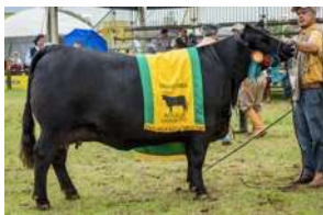
BARONESA – IRMÃ MATERNA DE REI