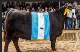
FILHA DE SERRUCHO