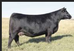
FILHA DE BISMARCK