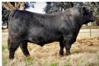
SALVAJE – PAI DE AFRODITE E AVÔ MATERNO DOS GRANDE CAMPEÕES DON EMILIO E GARDEL

O PACOTE VEM ACASALADO COM A LENDA ZORZAL , REPETINDO O MESMO ACASALAMENTO QUE PRODUZIU ERA SM209.