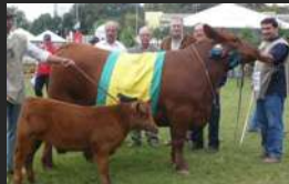
FILHA DE BRIGADIER