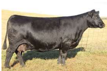
SAV PRISCILA 7809 - MÃE DE RUSSEL

COMBINA EM SEU PEDIGREE, SAV ANGUS VALLEY , REPRODUTOR QUE TRANSMITE EXCELENTE HABILIDADE MATERNA ALIADO A ADAPTABILIDADE COM SAV NET WORTH 4200 , TOURO MUITO UTILIZADO NO REBANHO ANGUS MUNDIAL.