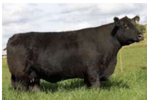
PWM PAINTING – IRMÃ MATERNA DE REI