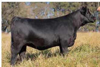
EPV MAGGIE 1918 – MAGGIE X CONRADE

O PACOTE VEM ACASALADO COM O BI GRANDE CAMPEÃO DE PALERMO, TRES MARIAS A348 DON EMILIO , QUE EM SUA PRIMEIRA GERAÇÃO PRODUZIU A CAMPEÃ BEZERRA E TERCEIRA MELHOR FÊMEA DE PALERMO 2019.