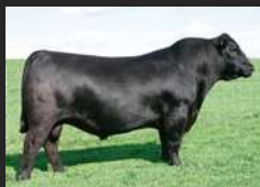
SAV BISMARCK 5682

FEDERAL – BI GRANDE CAMPEÃO DE PALERMO IRMÃO MATERNO DE SINALOA