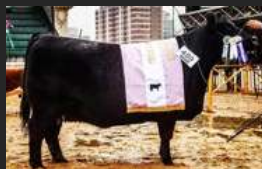
FILHA DE FEDERAL