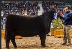
FILHA DE TM ZORZALITO