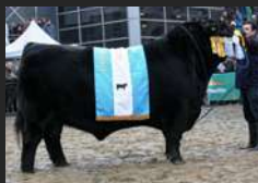
TRES MARIAS A348 DON EMILIO