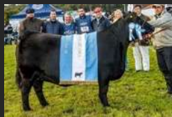
FILHA DE FEDERAL