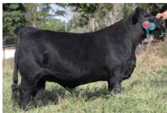
CAMBRIDGE – FILHA DE ROMANCE COM FEDERAL

O PACOTE B É ACASALADO COM ZORZALITO PRINCIPAL FILHO DO ZORZAL COM EXCELENTE PRODUÇÃO EM TODA AMÉRICA LATINA.