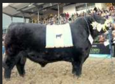
TRES MARIAS 6301 ZORZAL