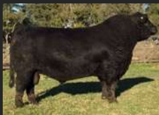
TRÊS MARIAS 9989 ZORZALITO TE