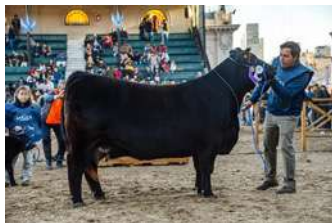
TM CATARINA – FILHA DE UMA IRMÃ DE REGADERA COM FEDERAL

NO PACOTE B REGADERA VEM ACASALADA COM O BI GRANDE CAMPEÃO DE PALERMO, TRES MARIAS 9257 FEDERAL , REMONTANDO A MESMA LINHA DE ACASALAMENTO QUE PRODUZIU TRES MARIAS CATARINA, POR DUAS VEZES RESERVADA CAMPEÃ EM PALERMO.