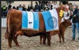
FILHA DE QUEBRANTADOR