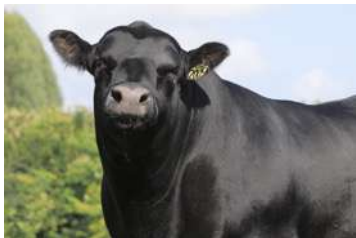
PWM TEMP - CABEÇA

É UM REPRODUTOR DE MUITO SELO RACIAL, EXCELENTE ESTRUTURA, PRECOCIDADE E GANHO DE PESO, O QUE NOS DA CONFIANÇA PARA INDICARMOS TANTO PARA REBANHOS PUROS COMO COMERCIAIS.