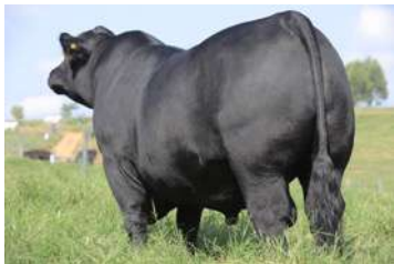
PWM TEMP - POSTERIOR