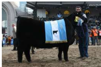
AREIA – BI GRANDE CAMPEÃ DE PALERMO IRMÃ DE SINALOA