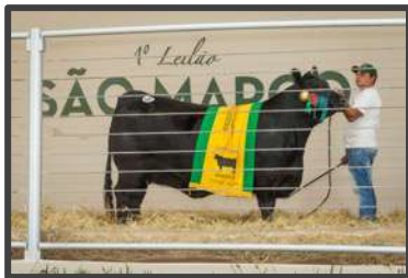
CAYENNE DURANTE O 1º LEILÃO SÃO MARCO

O PACOTE A É COM SERRUCHO , BI-GRANDE CAMPEÃO DE PALERMO E QUE EM SUA PRIMEIRA GERAÇÃO PRODUZIU RUBETA POMERRY , UMA DAS MAIS COMENTADAS FÊMEAS DA RAÇA NO MUNDO E QUE TAMBÉM SE SAGROU GRANDE CAMPEÃ EM PALERMO.