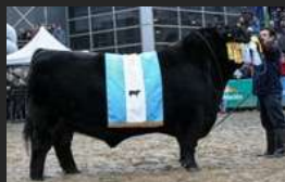
FILHO DE EURO