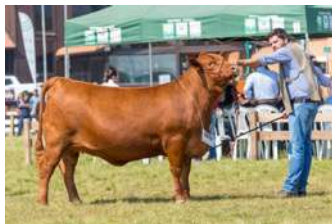
BIA – FILHA DE ANASTÁCIA COM AQUILES

NO PACOTE B VEM ACASALADA COM BRIGADIER , UM ÍCONE DO ANGUS COLORADO.