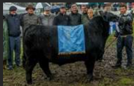
FILHO DE TM ZORZALITO