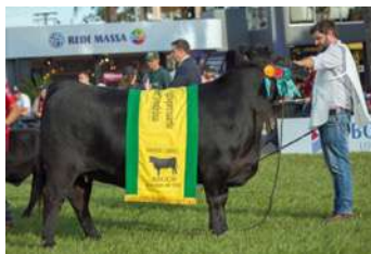
CAYENNE GRANDE CAMPEÃ EXPOLONDRINA 2019

O PACOTE B É COM ZORZALITO , PRINCIPAL FILHO DO ZORZAL EM PRODUÇÃO, PAI DE TRES MARIAS GARDEL , GRANDE CAMPEÃO NACIONAL ARGENTINO DE 2018.