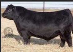
SAV RENOVATION 6822