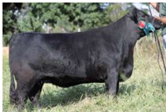
CAROL – FILHA DE ARENA COM CANDELERO

O PACOTE OFERECIDO É ACASALADO COM SERRUCHO , BI GRANDE CAMPEÃO DE PALERMO E PRODUTOR DA GRANDE CAMPEÃ DE PALERMO 2018.