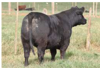
CALLE FILHA DE PAINTING COM CANDELERO

O PACOTE B É ACASALADO COM ZORZALITO QUE COMBINADO COM SALVAJE PRODUZIU TM GARDEL .