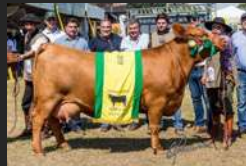
FILHA DE QUEBRANTADOR