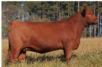
BELISSIMA FILHA DE 01 COM QUEBRANTADOR

O PACOTE É COM QUEBRANTADOR REPETE O ACASALAMENTO DE SUCESSO QUE PRODUZIU BELISSIMA SM10 QUEBRANT DE SÃO MARCO TRES VEZES CAMPEA NA PISTA DA EXPOINTER.