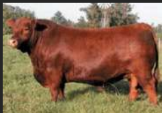
RUBETA 4444 QUEBRANTADOR TE