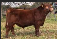
FILHO DE ENTRADOR