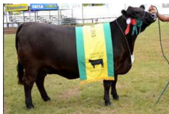
LC ARENA – MÃE DE CAROL

O PACOTE VEM ACASALADO COM O BI GRANDE CAMPEÃO DE PALERMO, TRES MARIAS A348 DON EMILIO, QUE EM SUA PRIMEIRA GERAÇÃO PRODUZIU A CAMPEÃ BEZERRA E TERCEIRA MELHOR FÊMEA DE PALERMO 2019.