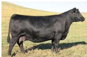
SAV BLACKCAP MAY 8051 - MÃE DE PUREBREED COMERCIALIZADA POR US$110.00,00 NO LEILÃO DA SAV EM 2016