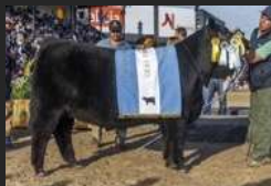
FILHA DE EURO