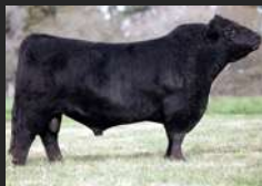
TRES MARIAS 8155 CANDELERO