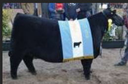
FILHA DE BISMARCK