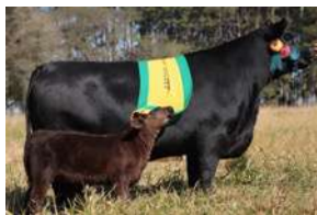
PWM RELIQUIA – IRMÃ MATERNA DE REI

REI POSSUI EXCELENTE PRODUÇÃO, TRANSMITINDO FRAME MODERADO, MUITO VOLUME E EXCELENTE CONFORMAÇÃO FRIGORIFICA.