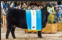
FILHA DE CANDELERO