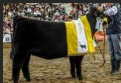
FILHA DE SERRUCHO