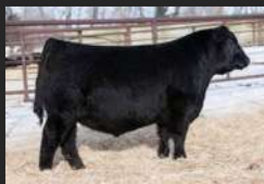
FILHO DE RENOVATION