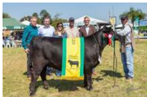
PWM ALINA – FILHA DE PUREBRED

REPRODUTOR ADQUIRIDO PELA CASA BRANCA NO LEILÃO DA SAV EM 2015 E SINDICALIZADO NO LEILÃO CASA BRANCA NO MESMO ANO, ATINGINDO A VALORIZAÇÃO DE R$816.000,00.